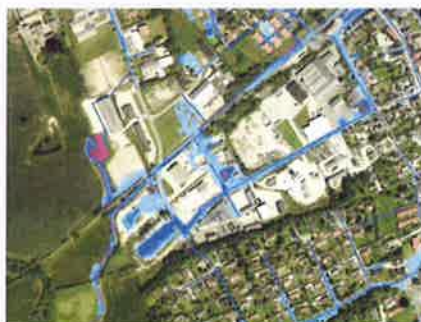
Eksempel på oversvømmelseskort

Oversvømmelseskortene vil herefter kunne indgå i den overordnede planlægning.